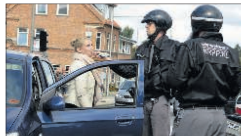
Den hollandske duo »Urban Safari« tog en tur rundt i byen iført politiuniformer. Her regulerede de blandt andet trafikken i krydset ved Algade/Københavnsvej, hvor en bilist blev tvunget til siden for at tage en »luft-prøve«.