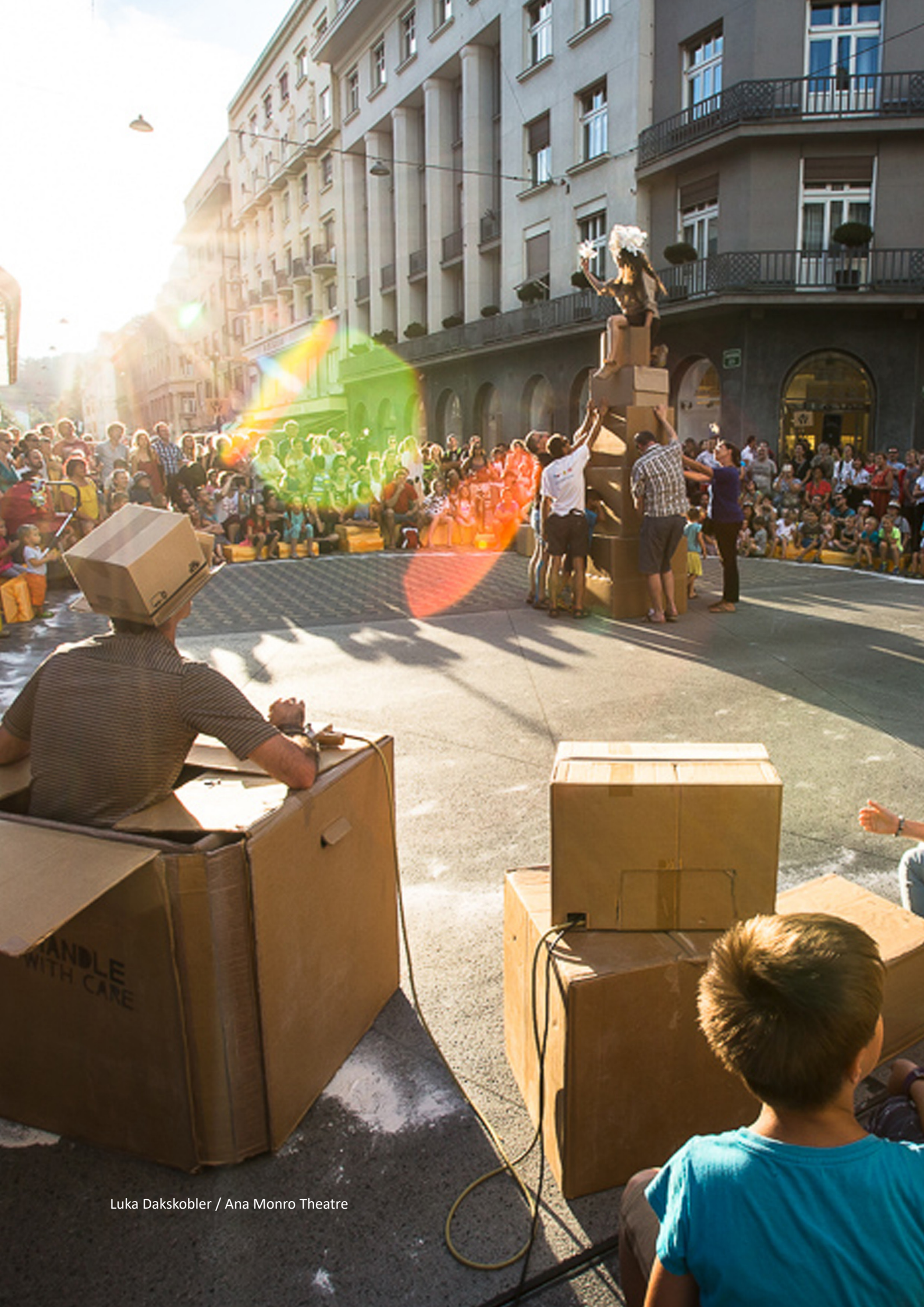
Luka Dakskobler / Ana Monroe Theatre